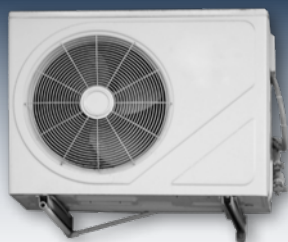
Klimatanläggningar och värmepumpar passar utmärkt att operera tillsammans med solel.

Också genom lagring av el kan egenförbrukningskvoten ökas ytterligare. Förnuftig användning av energilagring lämpar sig speciellt av det faktum att det resulterar i ytterligare fördelar.