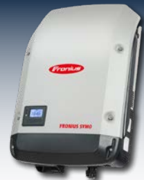
Växelriktare med integrerad energimanagementfunktion föreskriver maximalt utnyttjande av elen i enlighet med nätkraven.