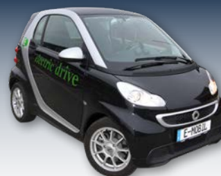
Elbilar kan lagra solel ekonomiskt och miljövänligt.