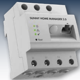
Intelligent utrustning säkerhetsställer en helt automatisk laststyrning.