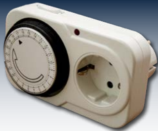
Timer, den enklaste formen av laststyrning.

Speciellt för kunder som inte är bundna till en specifik drifttid, är det extra lönsamt att använda solelen direkt. Modern teknik synkar konsumtion och produktion.