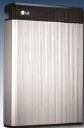
Batterilager möjliggör förbrukning av solenergi även på kvällen och natten.