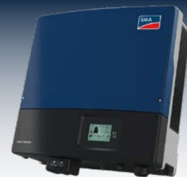
Wechselrichter mit integriertem Lastmanagement sorgen für eine maximale Stromausnutzung unter Einhaltung aller Netzanforderungen.