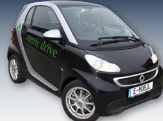
Elektroautos können Solarstrom wirtschaftlich speichern und machen so umweltfreundlich mobil.