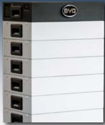
Batteriespeicher ermöglichen den Verbrauch von Solarstrom auch am Abend und in der Nacht.

Auch durch die Speicherung von Strom kann die Eigenverbrauchsquote weiter erhöht werden. Die sinnvolle Nutzung von Speichern lässt sich aber insbesondere durch sich daraus ergebende Zusatznutzen definieren.