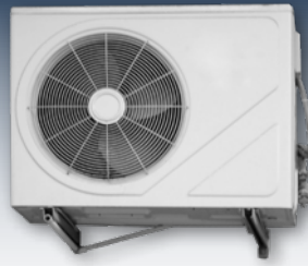
Klimaanlagen und Wärmepumpen eignen sich hervorragend für den Betrieb mit Solarstrom.